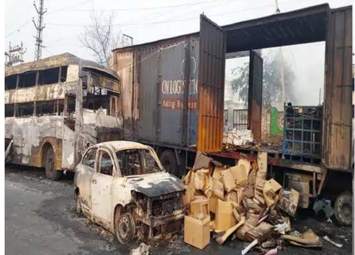
હતો. દરમિયાન જયપુર તરફથી આવી રહેલી ટ્રેક ટેન્કર સાથે

જયપુરમાં અજમેર હાઈવે પર દિલ્હી પબ્લિક સ્કૂલની સામે એલપીજી ગેસથી ભરેલા ટેન્કરમાં વિસ્ફોટ થયો હતો. આ અકસ્માતમાં ૧૧ લોકો જીવતા ભૂંજાયા અને ૩૩ લોકો દામ્ન્યા હતા. ટેન્કરને ટ્રેક ટક્કર મારી હતી. ટેન્કરમાંથી બહાર આવ્યા બાદ ગેસ ૨૦૦ મીટર સુધી ફેલાઈ