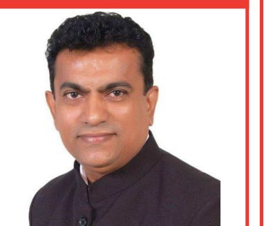
લેખક: ડો. અધિષ વી. ત્રિવેદી (એડવોકેટ, નોટરી અને સ્પ. પી.પી.)