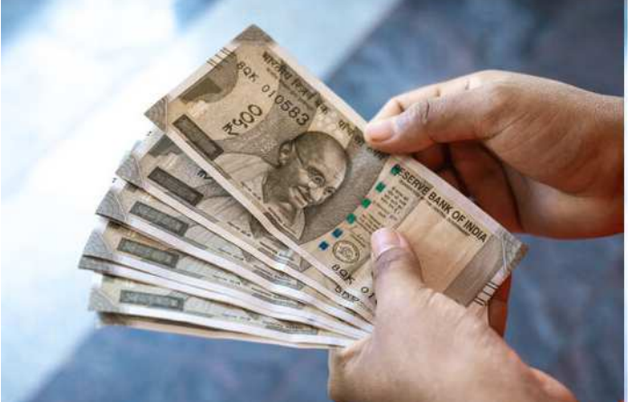
જીએસડીપીના ૨૩.૮૬ ટકા હતું, જે ઉત્તરોત્તર ઘટીને વર્ષ ૨૦૨૩-૨૪માં ૧૫.૩૪% થયું

રાજ્યના વિરોધ પક્ષ દ્વારા જાહેર દેવાને મુદ્દો બનાવવામાં આવે છે ત્યારે રાજ્ય સરકારે રાજ્યનું જાહેર દેવું ઘટ્યું હોવાની સત્તાવાર જાહેરાત કરી છે. રાજ્ય સરકારે રાજ્ય વિત્તીય ખાદ્ય નિયંત્રિત કરવામાં સફળ રહી હોવાનો દાવો કરીને જીડીપીના ૩ ટકાની મર્યાદા સામે વર્ષ ૨૦૨૪-૨૫માં માત્ર ૧.૮૬ ટકા અંદાજવામાં આવી છે. જ્યારે જાહેર દેવું વર્ષ ૨૦૦૦-૨૦૦૧