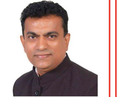
લેખક: ડો. અધિન વી. ત્રિવેદી (એડવોકેટ, નોટરી અને સ્પે. પી.પી.)